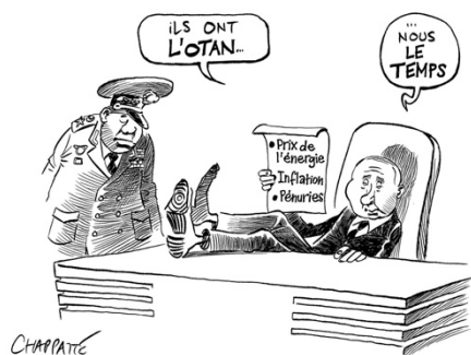
© Chappatte, « Une guerre asymétrique », dans Le Canard Enchaîné (29/08/2022)