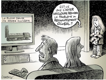
© Chappatte, « D'un collapse à l'autre », dans NZZ am Sonntag, Zürich (08/05/2022)

- https://www.lemonde.fr/economie/article/2022/05/03/la-guerre-en-ukraine-est-une-guerre-mediaticque-a-visages-humains_6124520_3234.html