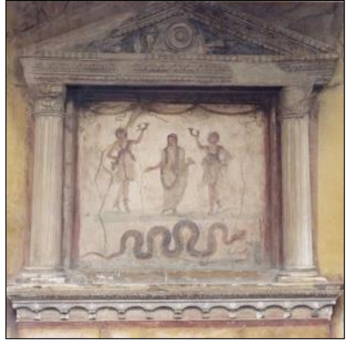
Lares succincti de Pompéi représentés suivant un type iconographique spécifique et aisément reconnaissable: ce sont deux jeunes gens à la tunique retroussé - tenant à la main un rhyton , vase à boire en forme de corne, et esquissant un pas de danse.