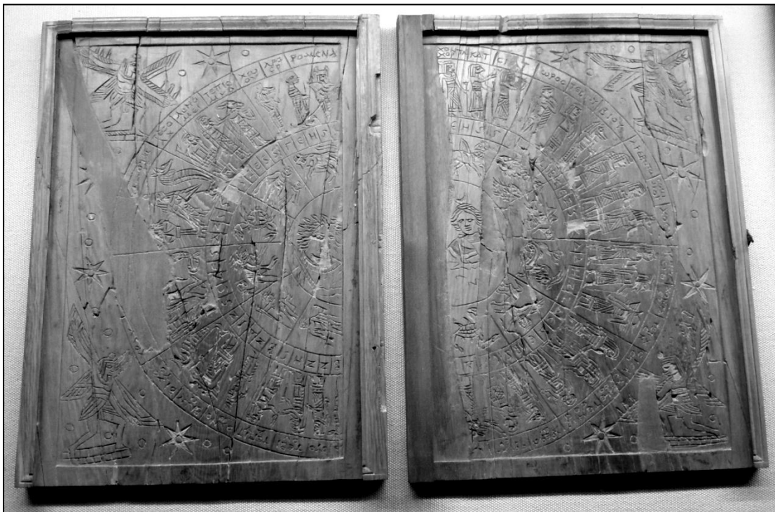
Tablettes zodiacales en ivoire du sanctuaire d'Apollon Granus (Grand, Vosges). Musée d'archéologie nationale de Saint-Germain-en-Laye (France) - IIe siècle - découvertes en 1968