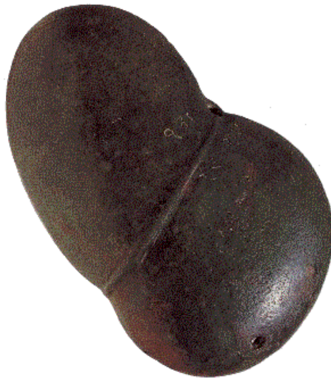
Foie d'ovin en bronze retrouvé Plaisance datant IIe-Ier av