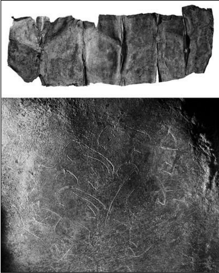
Tablette de défixion (découverte au Mans en 2011) 1