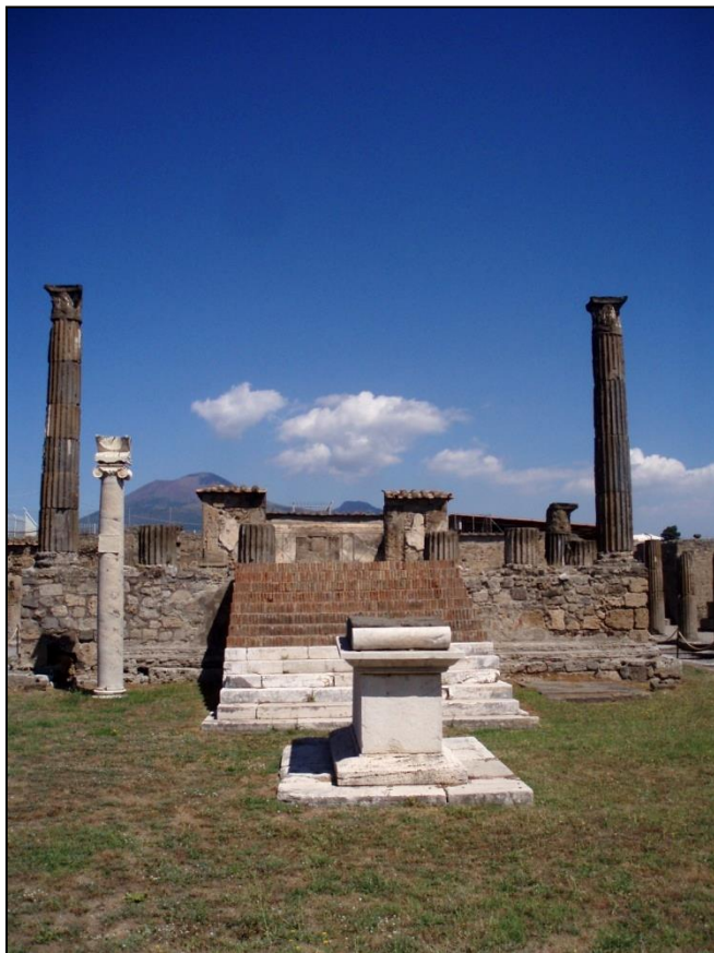
Le Temple d'Apollon (Pompéi)